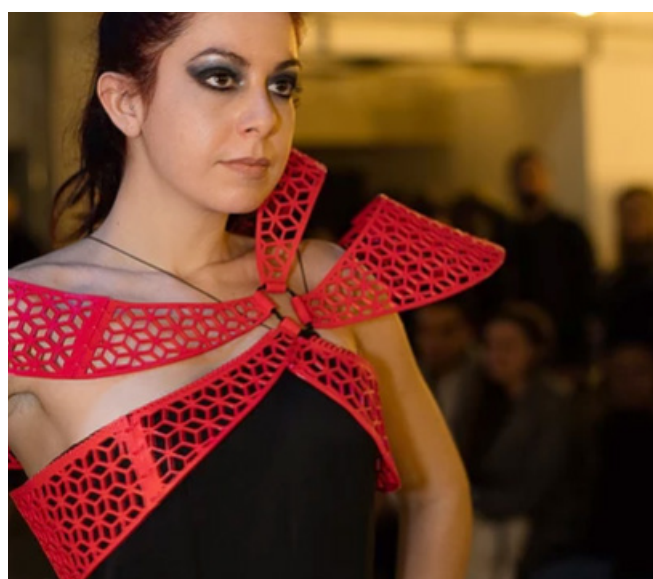
Robe réalisée par Marisa Garnier durant un défilé

« Afin d'incorporer de l'artisanat aux nouvelles techniques, notre dentelle 3D est réalisée à la main à l'aide de stylo 3D et de beaucoup de patience et de minutie. »