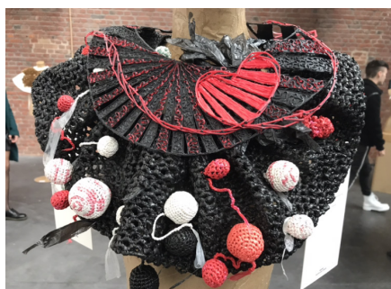
«Love Colar», parure.