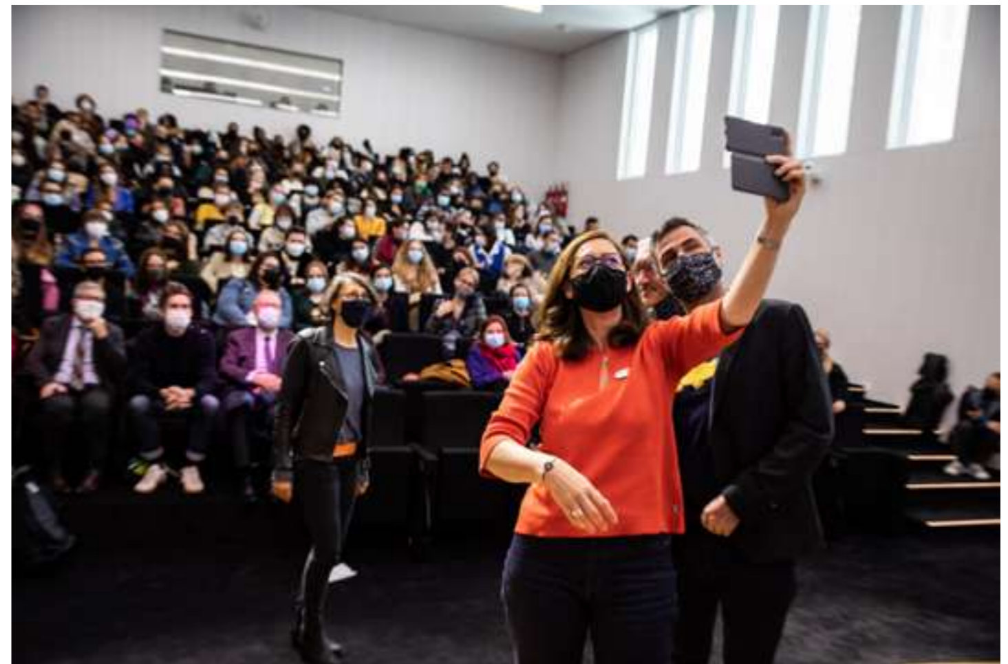
Conférences en Île-de-France