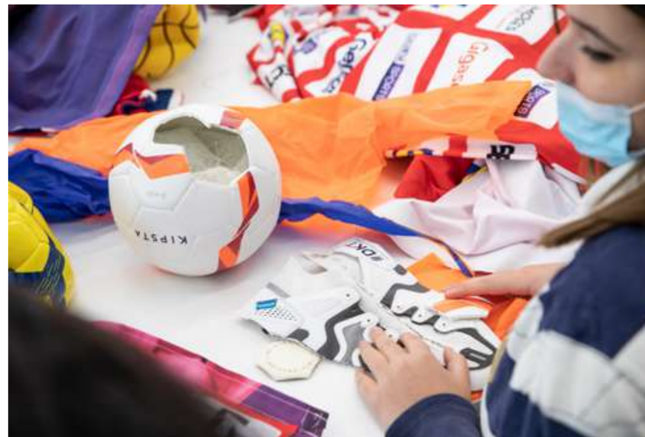
Ateliers avec les étudiants des campus

Les pièces réalisées par les étudiants seront exposées en juin 2023 et présentées devant un jury composé de personnalités de la mode, du sport et de l'écologie, lequel choisira 5 lauréats. Les lauréats de la région rejoindront les 8 lauréats de la région Île-de-France et des autres régions, et seront exposés avec les parures de créateurs internationaux à Paris ou en Seine-Saint-Denis, à l'occasion des Jeux olympiques et paralympiques de Paris 2024 entre juillet et septembre 2024, puis dans les villes partenaires d'octobre à décembre 2024.