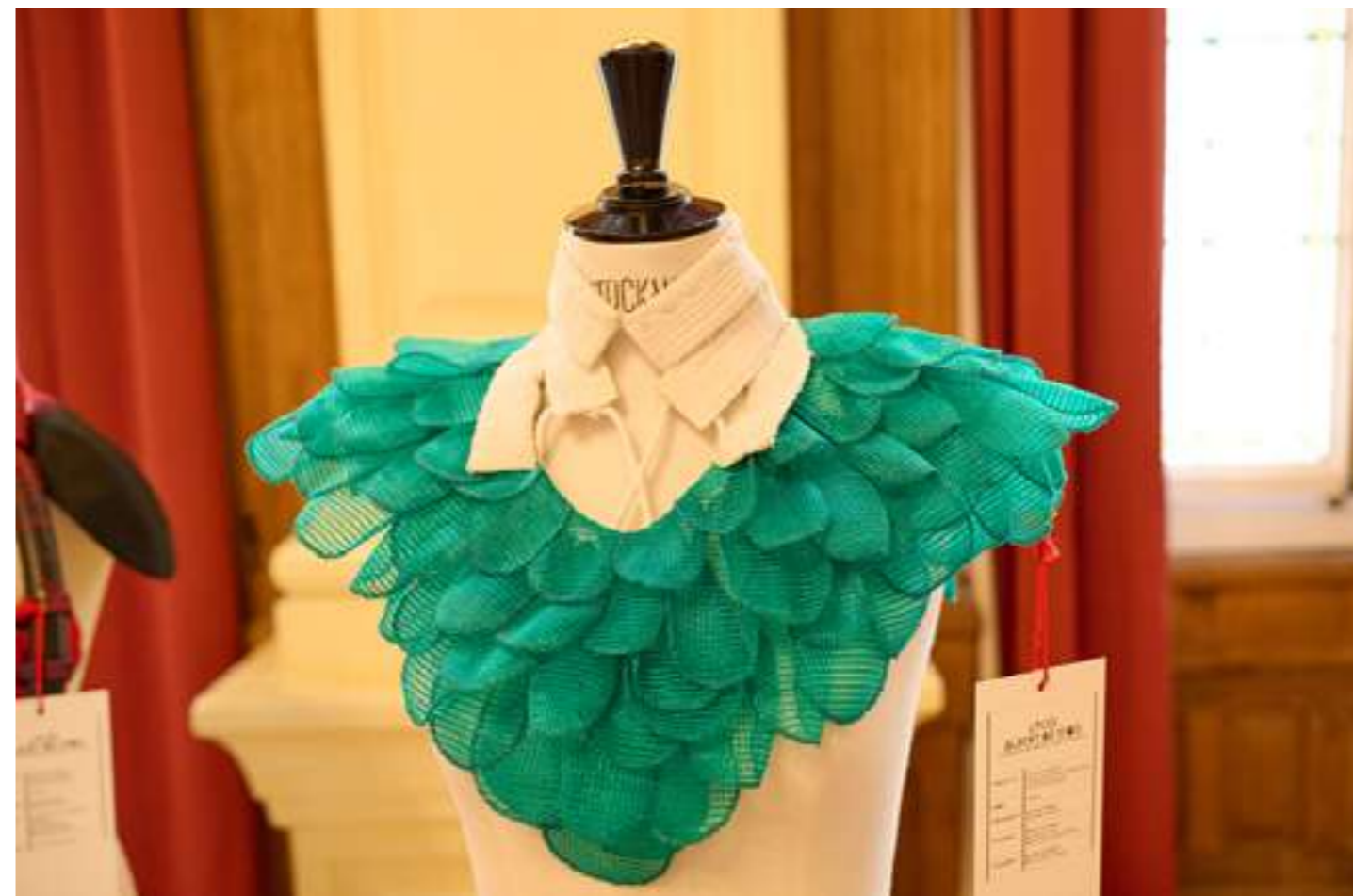
Parure Empire lauréate en Île-de-France