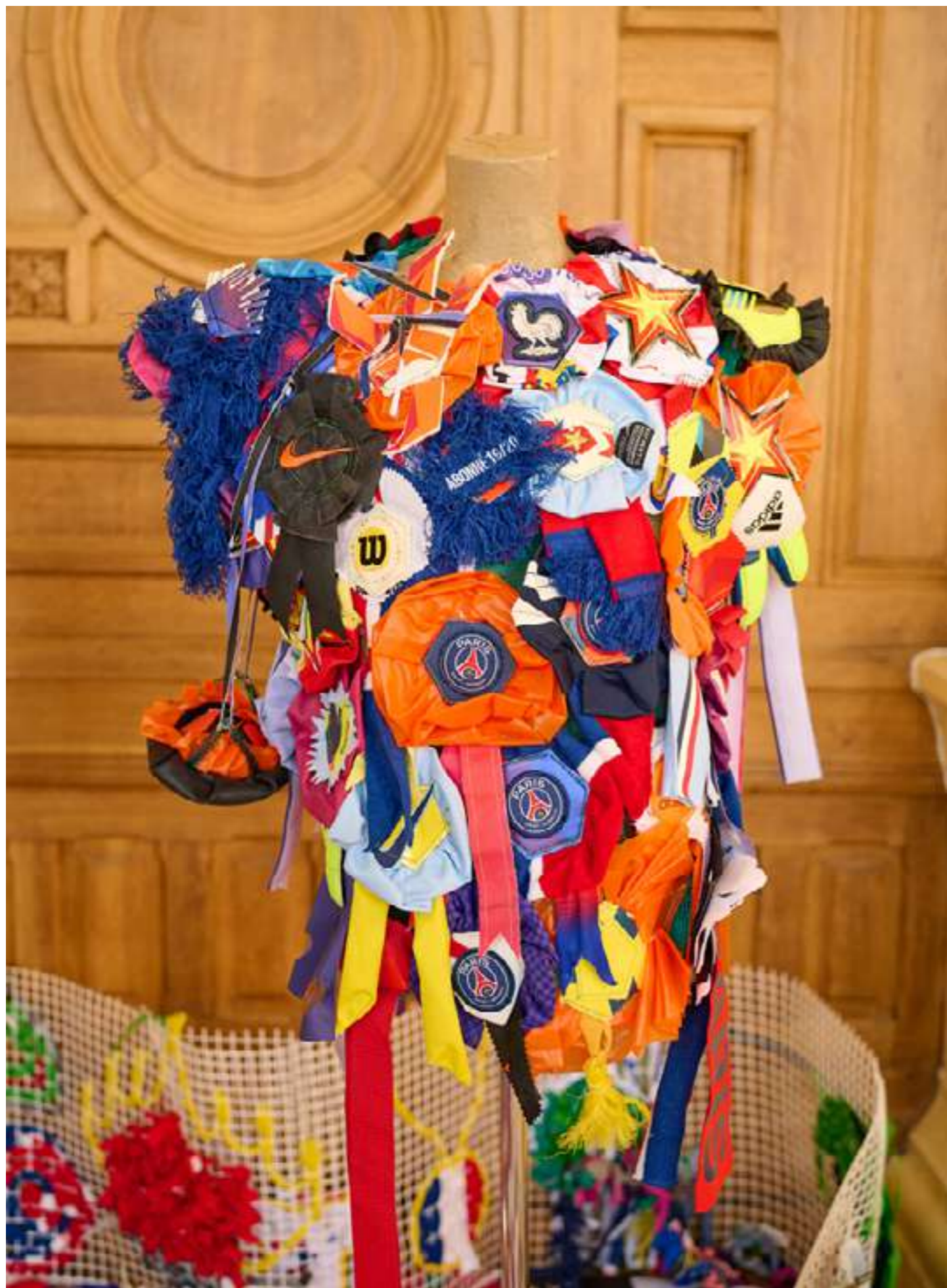
Parure réalisée durant les ateliers