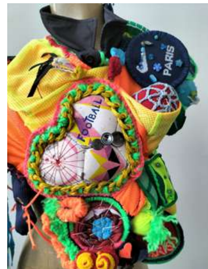
Parure réalisée lors du lancement