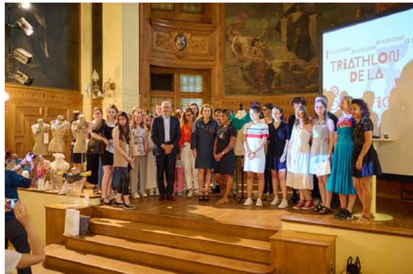
Remise des prix